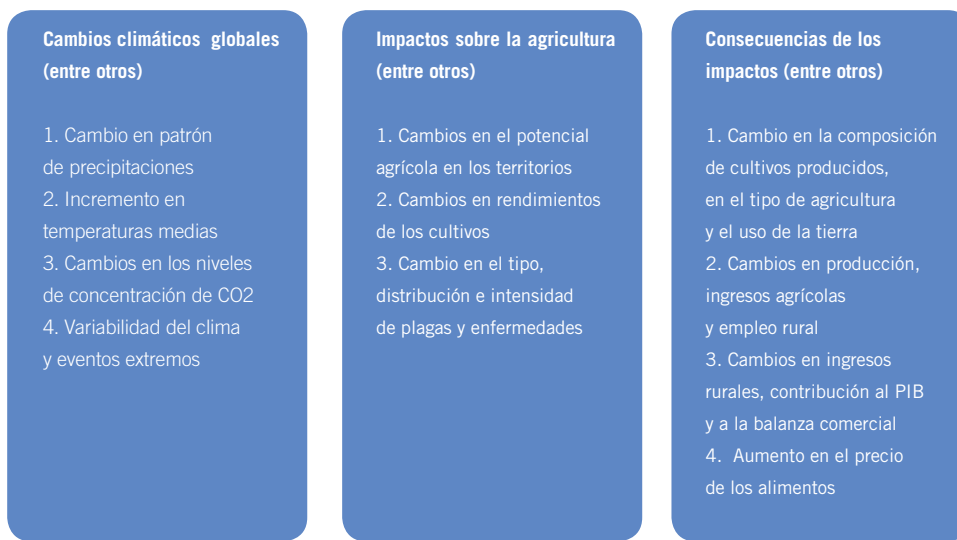
Figura 1. Consecuencias del impacto climático en la agricultura.