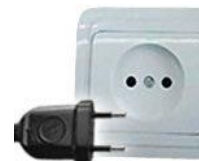
Tipo C: Válido para clavijas E y F

Las clavijas a utilizar En Argentina son del tipo C / I: