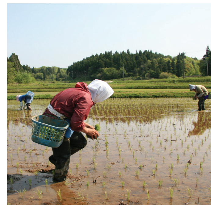
La gestión sostenible del paisaje de Satoyama-Satoumi en Japón genera resiliencia frente al cambio climático.

disminuir la emisión de gases de efecto invernadero procedentes de la agricultura, mejorar la retención de carbono y aumentar la resiliencia ante el cambio climático.