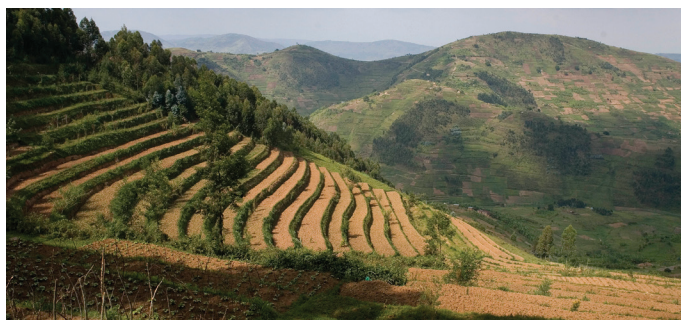
Vista de terrazas en laderas, que ayudan a los bosques a retener el agua y prevenir la erosión.