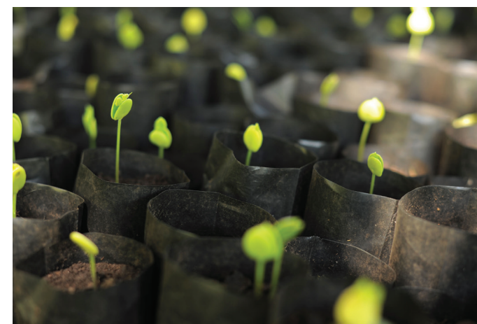
Plántulos de moringa en un vivero forestal. El árbol de moringa puede jugar un importante papel en la mitigación del cambio climático y en aumentar los ingresos de los agricultores pobres en África.