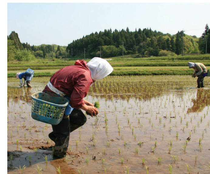
La gestione sostenibile del paesaggio Satoyama-Satoumi in Giappone produce la capacità di ripresa ai cambiamenti climatici.

mondiale di carbonio presente nel suolo. Tuttavia, rigenerando i terreni degradati e adottando pratiche di conservazione del suolo, esiste la possibilità concreta di diminuire le emissioni di gas serra prodotte dall'agricoltura, migliorare il sequestro del carbonio e favorire l'adattamento al cambiamento climatico.