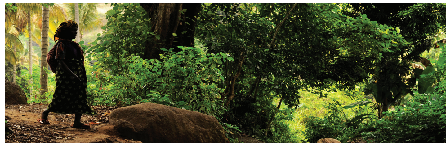
Una donna che attraversa uno dei tanti corsi d'acqua che alimentano un canale d'irrigazione in Tanzania usato per la cosiddetta "agricoltura intelligente" dal punto di vista del clima.

Organizzazione delle Nazioni Unite per l'alimentazione e l'agricoltura