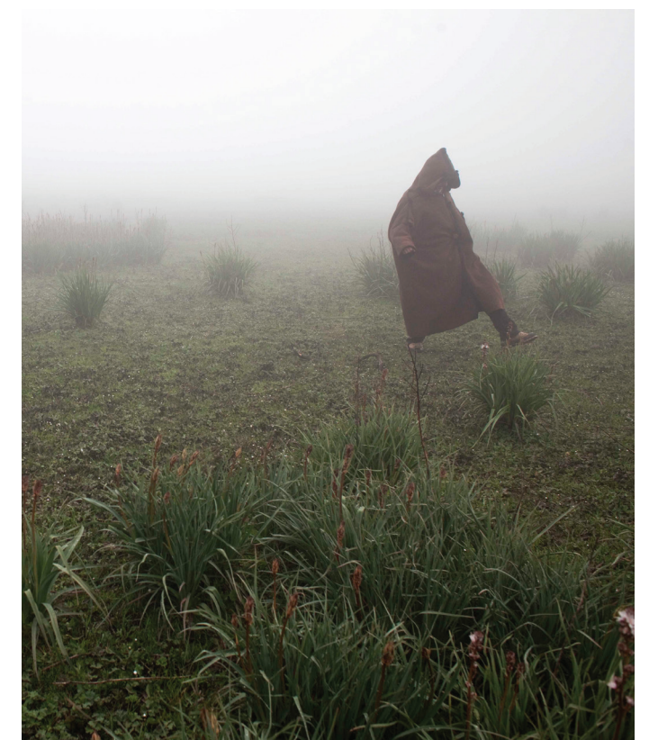
Un abitante di un villaggio che attraversa a piedi una torbiera in Tunisia.