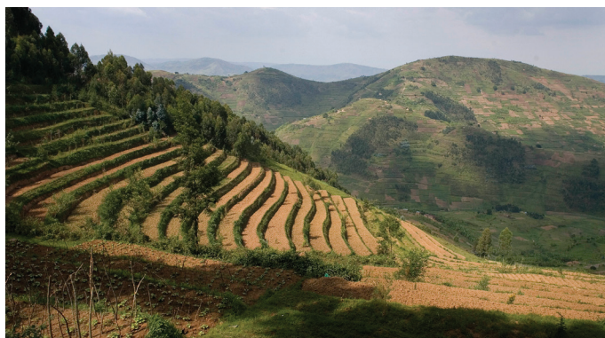
Veduta di terrazzamenti che aiutano i suoli a trattenere l'acqua e prevenire l'erosione.