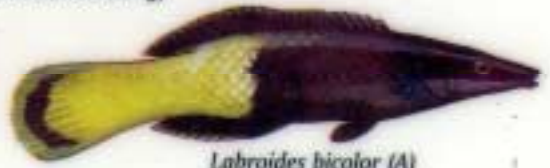
Labroides bicolor (A)