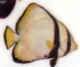
Platax pinnatus (A)