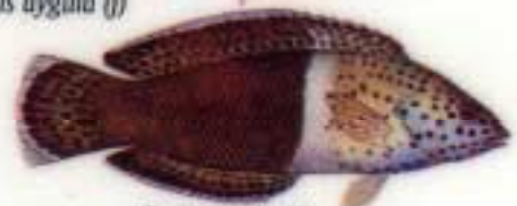
Coris aygula (A)