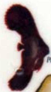
Platax pinnatus (J)