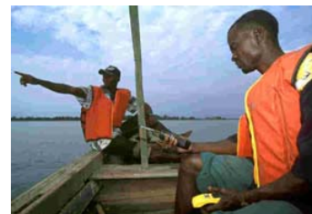
Os pescadores observam as traineiras industriais na sua zona de pesca

O fórum contribuiu igualmente a melhor sensibilizar aqueles que decidem e os parceiros ao desenvolvimento sobre a necessidade de integrar os esforços de desenvolvimento das pescas artesanais num processo global de ordenamento das zonas costeiras. O fórum foi a ocasião de informar os que decidem sobre os processos de mudança que seria desejável operar no sistema de vigilância costeira, se se deseja melhorar os meios de existência na pesca.