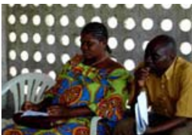
Os membros da UCN trocam ideias sobre os indicadores durante uma formação sobre o acompanhamento participativo na RDC

A UCN da República Democrática do Congo estuda as possibilidades de colaboração com a secção local de Oxfam UK que adoptou “a abordagem dos meios de existência” como principal abordagem para dirigir o seu novo plano estratégico. Quando dos primeiros contactos, a ONG confirmou o seu interesse em enviar alguns membros do seu pessoal participar na formação sobre a utilização do Guia elaborado pelo PMEDP para a preparação de projectos comunitários, que será organizada pela UCN. Foi prevista uma segunda reunião a fim de permitir à UCN discutir uma proposta de colaboração para avaliar a contribuição da pesca artesanal aos meios de existência das comunidades de pesca nas províncias de Kinshasa, de Bandundu e do Equador.