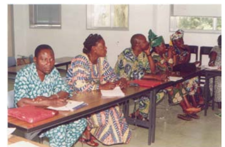
Discussion entre les membres de la nouvelle Association des mareyeurs du Bénin sur la nécessité d'établir des relations de partenariat durable.

Les activités programmées comprennent le renforcement de la gestion organisationnelle et des aptitudes en communication des membres exécutifs du bureau. Une ONG a été déjà identifiée pour assister l'Association dans la mise en œuvre du projet.