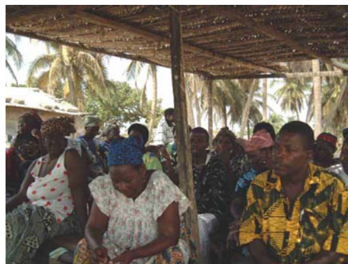
Le comité de gestion de la communauté de pêche de Adina (Ghana) identifie les opportunités de diversification de ses stratégies de moyens d'existence

opportunités de diversification des moyens d'existence pour accroître leurs revenus. La responsable des projets a appuyé l'UCN dans la reformulation des propositions de projets communautaires.