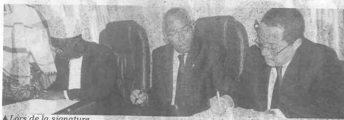
▲ Lors de la signature

Les objectifs de ce nouveau financement consistent à accroître la performance de l'Administration générale des impôts et domaines en renforçant les compétences et moyens de son personnel, améliorer la recevabilité de l'Etat en consolidant les capacités de prévision et de gestion de la trésorerie par la direction générale de la comptabilité publique et du trésor (Dgcpt), renforcer le contrôle des marchés publics en professionnalisant la direction nationale du contrôle des marchés publics (Dncmp) et des cellules de passation des marchés, développer des actions transversales de renforcement des autres services prioritaires de l'Etat en charge de la gouvernance