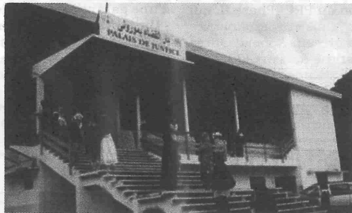
▲ Palais de justice