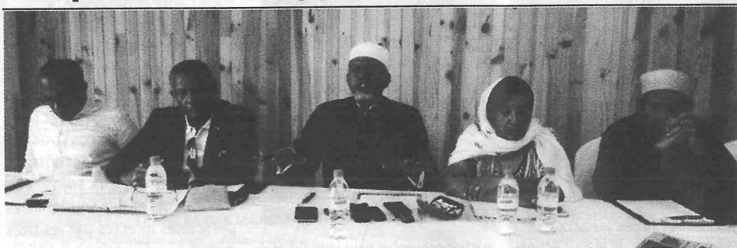
▲ La coordination du M11

Les membres du mouvement du 11 août (M 11) ont tenu une conférence de presse samedi dernier à Moroni. L'objectif est de relancer ses activités avec toujours les mêmes objectifs fondamentaux des assises nationales. Dans une déclaration commune le M 11 prévoit de sensibiliser la population comorienne dans les prochains jours.