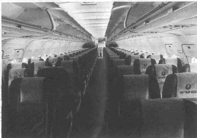
▲ Des sièges vides de l'Airbus

Le vol de l'appareil A 320 en provenance de Mayotte vers Moroni, de la compagnie arienne d'Inter Ile Air a effectué son premier vol commercial hier avec 0 passager, alors 130 passagers devaient y embarquer. La cause, l'aviation civile de Mayotte refuse de donner l'autorisation. Alors que « tous les dossiers requis sont fournis.»