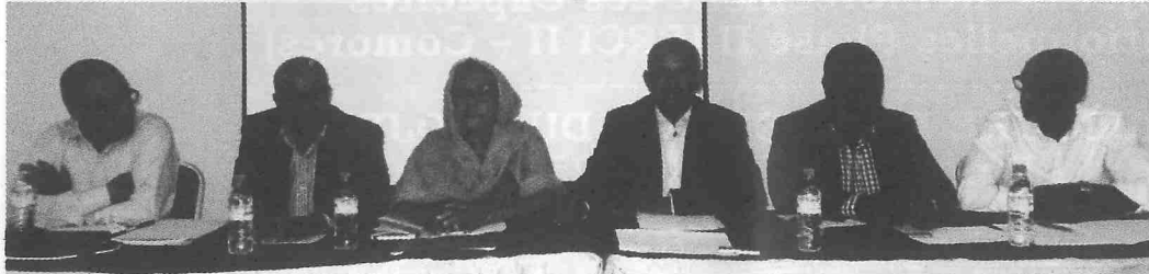
▲ Les dirigeants de la Nouvelle OPACO

Une nouvelle organisation patronale baptisée «Nouvelle OPACO» vient de naître, avec pour ambition d'«être le partenaire entrepreneurial de référence pour un développement économique et social équitable et responsable.»