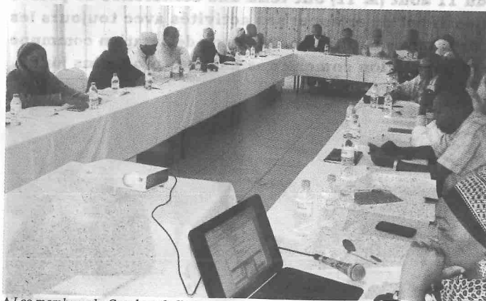
▲ Les membres du Ccm lors de l'Ag

L'instance de coordination nationale Ccm-Comores a tenu sa dernière Assemblée Générale de l'année 2016. Il était question de revoir le rapport technique et financier et le plan de travail de janvier à juin 2017. Un projet d'un nouveau bâtiment est en gestation pour doter de Ccm-Comores d'un siège.