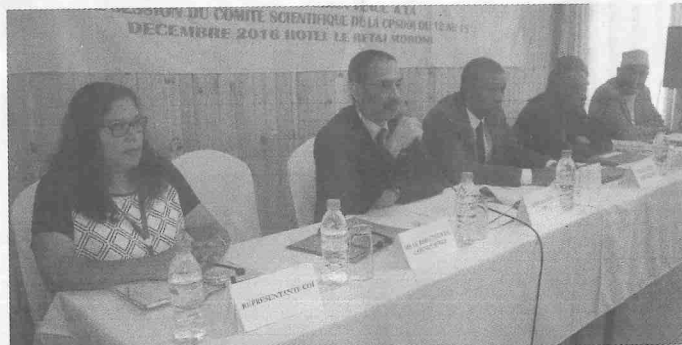
▲ Lors de l'ouverture

Ouverture de la septième session du comité scientifique, de la commission des pêches de l'Océan indien sud-ouest, (Cpsooi). Cette session s'est ouverte hier à Moroni et durera quatre jours. Et tous les pays membres sont représentés.