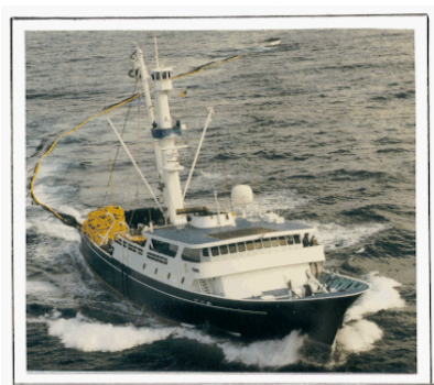
FISHSTAT FF1 ПАЛУБНЫЕ СУДА