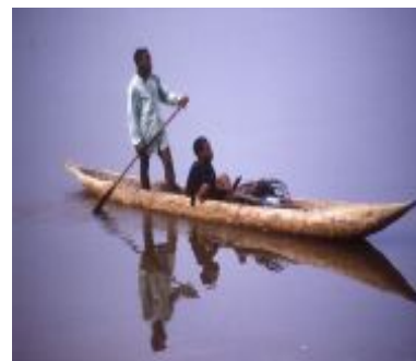
FISHSTAT FF2 БЕСПАЛУБНЫЕ СУДА

1. В данных должно быть указано общее количество рыболовецких судов, имеющих в стране, в следующем порядке: