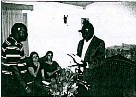
Le coordinateur régional du projet remet les documents au gouverneur.