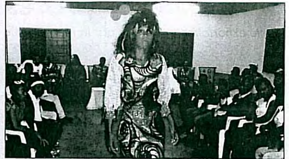
L'assistance suivant le passage d'un mannequin lors du défilé de mode à Bitam.

quelles sont souvent confrontées les familles démunies lors de la rentrée des classes.