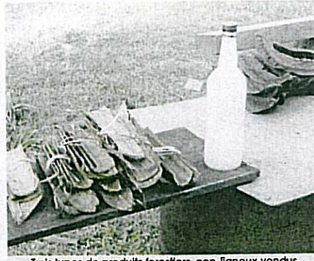
Trois types de produits forestiers non-ligneux vendus à 70 km de Libreville.

des résultats obtenus. En effet, sur certains marchés de Libreville se vendent des produits issus de la forêt, comme la noix de kola, les légumes « nkoumou », l'odika, le vin de palme, les noisettes, les feuilles avec lesquelles est conditionnée la pâte de tubercules de manioc... Certains états, le long de la Nationale 1, commercialisent des écorces, des ra-