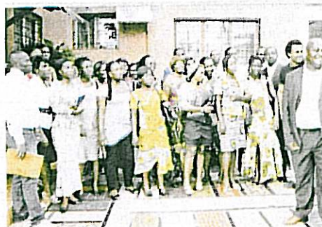
Les étudiants de l'Esam ont posé pour la postérité.