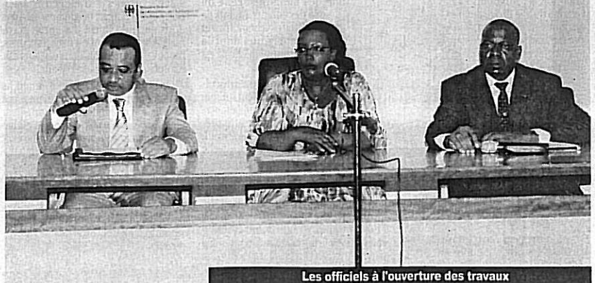
Les officiels à l'ouverture des travaux

du Comité consultatif national sur les produits forestiers non ligneux (PFNL) au Gabon, Libreville, du 22 au 23 novembre 2011. Auditorium de l'Institut des Eaux