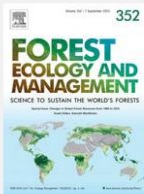
Numéro spécial Forest Ecology and Management