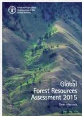
Répertoire de données de FRA 2015