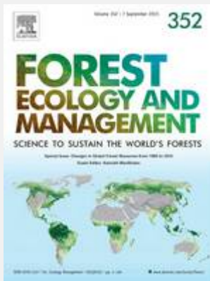
Número especial Forest Ecology and Management