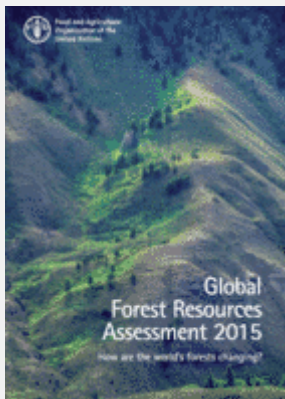
Documento de síntesis