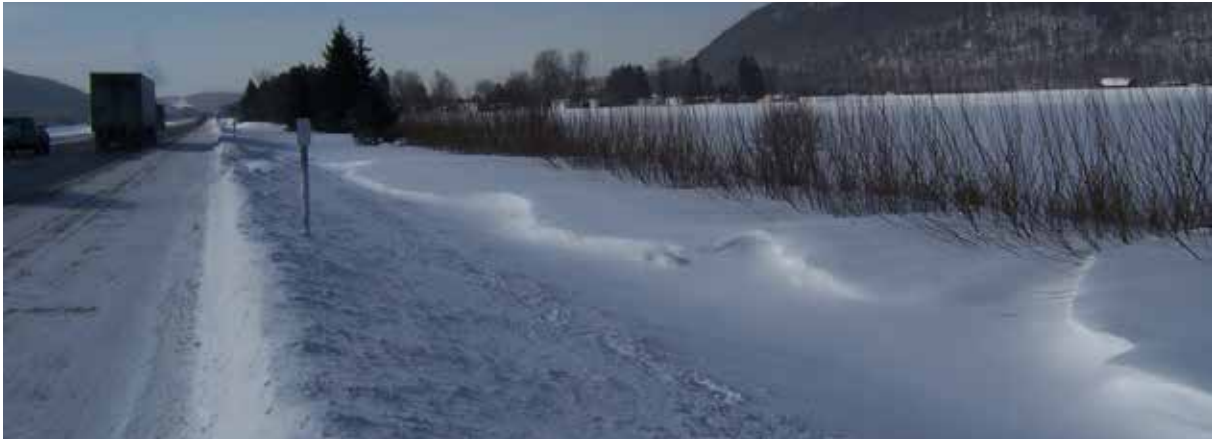
Fig.2: Sauces plantados a lo largo de una carretera nacional en Nueva York, con una distancia de separación de sólo 10 m y gran cantidad de nieve a favor del viento en temporada, totalmente contenida dentro de la distancia de separación entre la cerca y la carretera.

Ambiental y Forestal (SUNY-ESF) ha demostrado que las tendencias de crecimiento de las cortinas de sauce pueden, en un invierno promedio, tener suficiente capacidad de almacenamiento de nieve para la mayoría de los lugares en todo el estado de Nueva York, a sólo tres años después de la siembra cuando se emplean las mejores prácticas de manejo (Figura 1). Un conjunto de mejores prácticas para la implementación de cortinas de sauce han sido desarrolladas por SUNY-ESF para garantizar este nivel de funcionalidad rápida, la supervivencia a largo plazo, y el máximo retorno de la inversión. Estas prácticas (que también se pueden aplicar a las cercas de nieve de otros tipos de vegetación viva) incluyen la selección de plantas, preparación del sitio, técnicas de siembra, control de malezas y el manejo integrado de plagas.