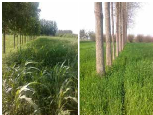
Álamos y sorgo

2 = Thuenen-Instituto de Genética Forestal, Sieker Landstr. 2, 22927 Grosshansdorf, Alemania