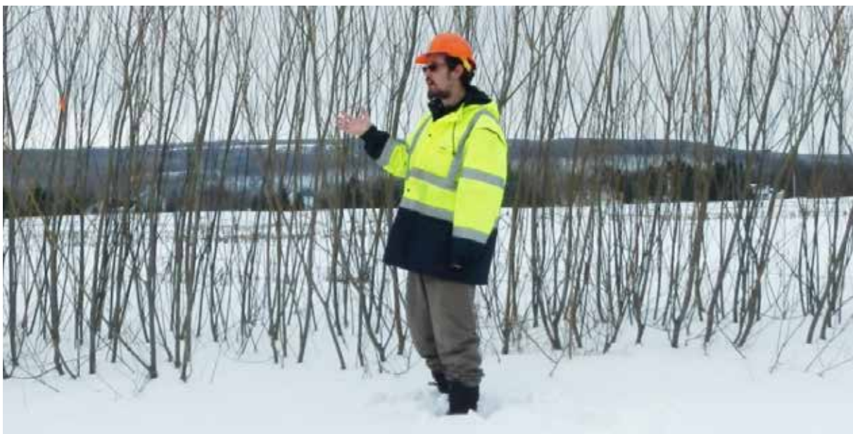
Fig. 1: Cerca viva/ cortina de sauce en el estado de Nueva York a tan sólo cuatro años después de la siembra con la altura y la densidad de ramas suficiente para tener una capacidad de almacenamiento de nieve trece veces mayor que la cantidad media anual de nieve arrastrada por acción del viento a ese lugar..

La alta densidad de ramas y rápido crecimiento en altura de los sauces proporcionan las dos características de la vegetación más importantes para la captura y el almacenamiento de la nieve. Un estudio reciente realizado por investigadores de la Universidad Estatal de Nueva York Instituto de Ciencia