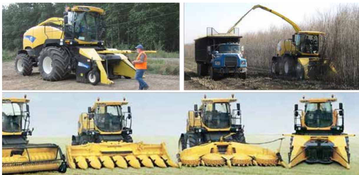
Fig. 1: Arriba a la izquierda: Una New Holland FR 9060 cosechadora de forraje con un cabezal 130 FB anexo a la misma, se está preparando para una cosecha de álamo híbrido en Western Oregon. Arriba a la derecha: Un FR-9080 cosechadora de forraje que opera en una plantación de sauces en Auburn, Nueva York en noviembre de 2012. Abajo: Los ejemplos de cabezales disponibles para el FR 9000- serie de cosechadoras de forraje, incluyendo la cabecera de monte bajo 130 FB en el extremo derecho.

La Universidad Estatal de Nueva York – Facultad de Ciencias Ambientales y Forestales en colaboración con Greenwood Resources (Portland, OR) y New Holland (New Holland, PA) han llevado a cabo ensayos de cosecha de cultivo de sauces de corta rotación y de plantaciones de álamos híbridos con el objetivo de mejorar las plataformas de las cosechadoras “New Holland” desde 2010, el apoyo financiero ha sido proporcionado por el Departamento de Programa de Energía de Biomasa (USDOE-BETO), el organismo para la Investigación y Desarrollo de la Energía del estado de Nueva York (NYSERDA), y