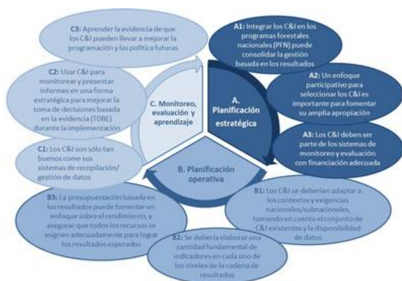
Figura 2. Uso de los C&I por estadio del ciclo de vida de la GBR

Se pueden aplicar C&I en las tres principales estrategias de la GBR en un ciclo de programa: 1) planificación estratégica (p.ej., diseño de política/programa); 2) planificación operativa; 3) monitoreo, evaluación y aprendizaje (véase la Figura 2)