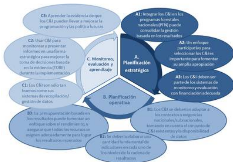
Figura 2. Uso de los C&I por estadio del ciclo de vida de la GBR

Se pueden aplicar C&I en las tres principales estrategias de la GBR en un ciclo de programa: 1) planificación estratégica (p.ej., diseño de política/programa); 2) planificación operativa; 3) monitoreo, evaluación y aprendizaje (véase la Figura 2)