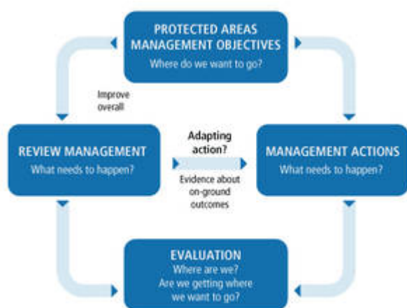
Figure 2. Processus de planification de gestion participative, rationnelle et adaptative (Spoelder, P. et al., 2015)

L'élaboration d'un plan de gestion d'une aire protégée comporte généralement quatre étapes, qui s'inscrivent dans un processus de planification participative, rationnelle et adaptative.