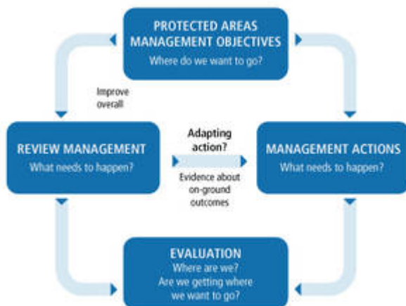
Figure 2. Processus de planification de gestion participative, rationnelle et adaptative (Spoelder, P. et al., 2015)

Alors que chacune des six catégories d'aires protégées visent des objectifs différents, elles doivent toutes prévoir un processus de planification de gestion approprié. L'UICN a développé des orientations en matière de gestion pour chacune de ses catégories d'aires protégées.