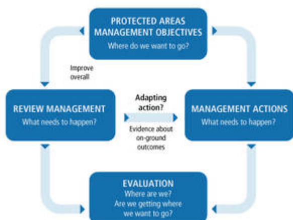
Figure 2. Processus de planification de gestion participative, rationnelle et adaptative (Spoelder, P. et al., 2015)

L'élaboration d'un plan de gestion d'une aire protégée comporte généralement quatre étapes, qui s'inscrivent dans un processus de planification participative, rationnelle et adaptative.