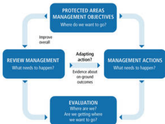
Figure 2. Processus de planification de gestion participative, rationnelle et adaptative (Spoelder, P. et al., 2015)

Alors que chacune des six catégories d'aires protégées visent des objectifs différents, elles doivent toutes prévoir un processus de planification de gestion approprié. L'UICN a développé des orientations en matière de gestion pour chacune de ses catégories d'aires protégées.