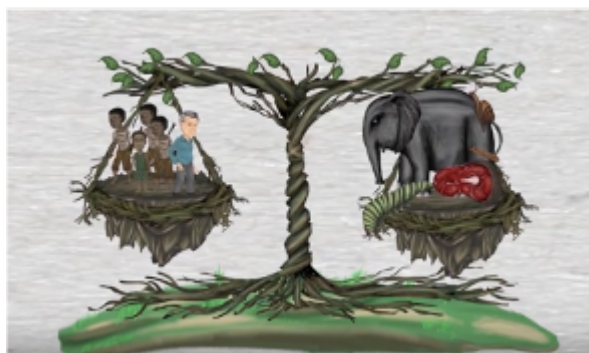
Utilisation durable de la viande de brousse

Pour la Convention sur la diversité biologique, l'expression viande de brousse est définie comme toute viande d'animal sauvage chassé à des fins alimentaires et non-alimentaires, y compris l'usage médical, dans les pays tropicaux et sous-tropicaux. Puisque la chasse aux animaux sauvages à des fins alimentaires et de subsistance est aussi présente dans d'autres régions, l'expression viande de brousse, ou viande sauvage, est désormais utilisée. La même terminologie sera appliquée ici avec l'intention d'être plus inclusifs géographiquement (Coad et al., 2018).