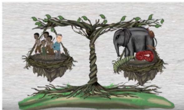
Utilisation durable de la viande de brousse

Pour la Convention sur la diversité biologique, l'expression viande de brousse est définie comme toute viande d'animal sauvage chassé à des fins alimentaires et non-alimentaires, y compris l'usage médical, dans les pays tropicaux et sous-tropicaux. Puisque la chasse aux animaux sauvages à des fins alimentaires et de subsistance est aussi présente dans d'autres régions, l'expression viande de brousse, ou viande sauvage, est désormais utilisée. La même terminologie sera appliquée ici avec l'intention d'être plus inclusifs géographiquement (Coad et al., 2018).