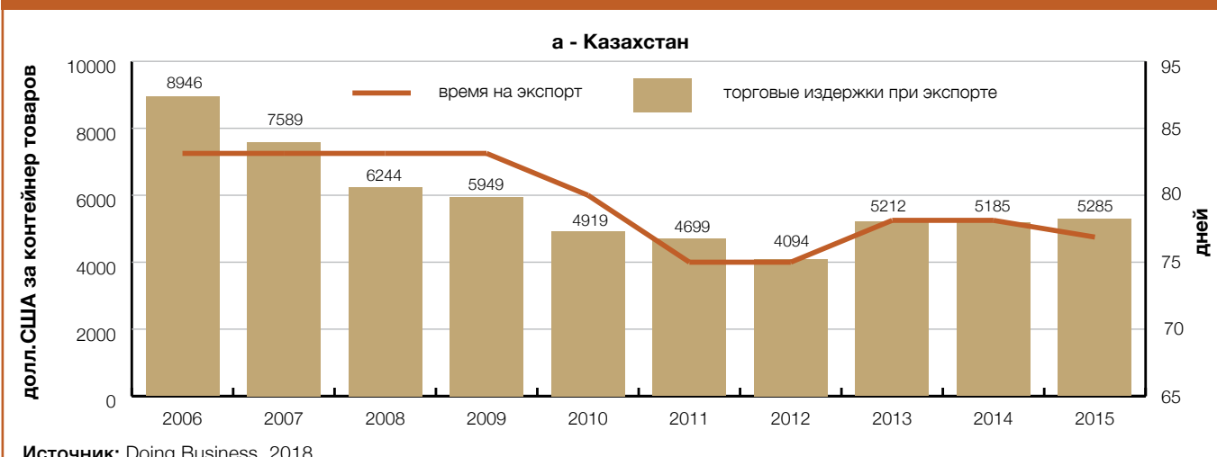
Рисунок 2 а. Динамика стоимости торговых издержек и времени на экспорт в странах ЦА

Таким образом, можно заключить, что с 2006 года в ЦА странах условия ведения экспорта несколько улучшились. Данное улучшение можно объяснить постепенным упрощением прохождения таможенных процедур, а также